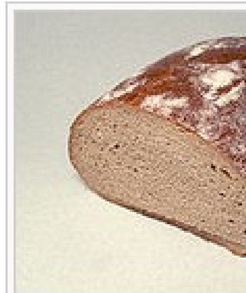
Brood gemaakt van zuur

Zuurdeeg kan men zelf maken door meel en water enkele dagen te laten gisten aan de lucht. Het zure deeg moet daarna gemengd worden met meer meel, en nog 24 uur staan. Zuurdesem wordt net als gist gebruikt om deeg te laten rijzen.