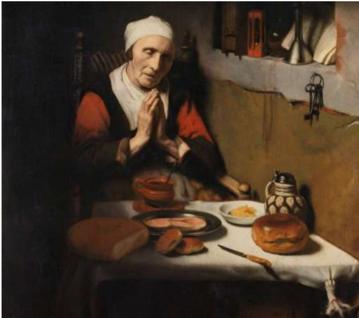
Nicolaes Maes, 'gebed zonder end' (1656)