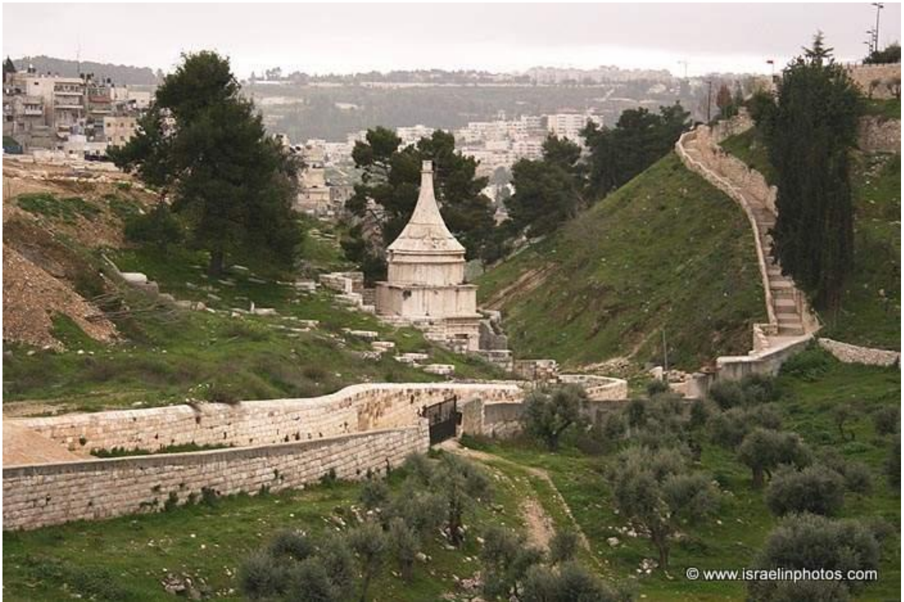
het zgn. graf van Absalom bij Jeruzalem